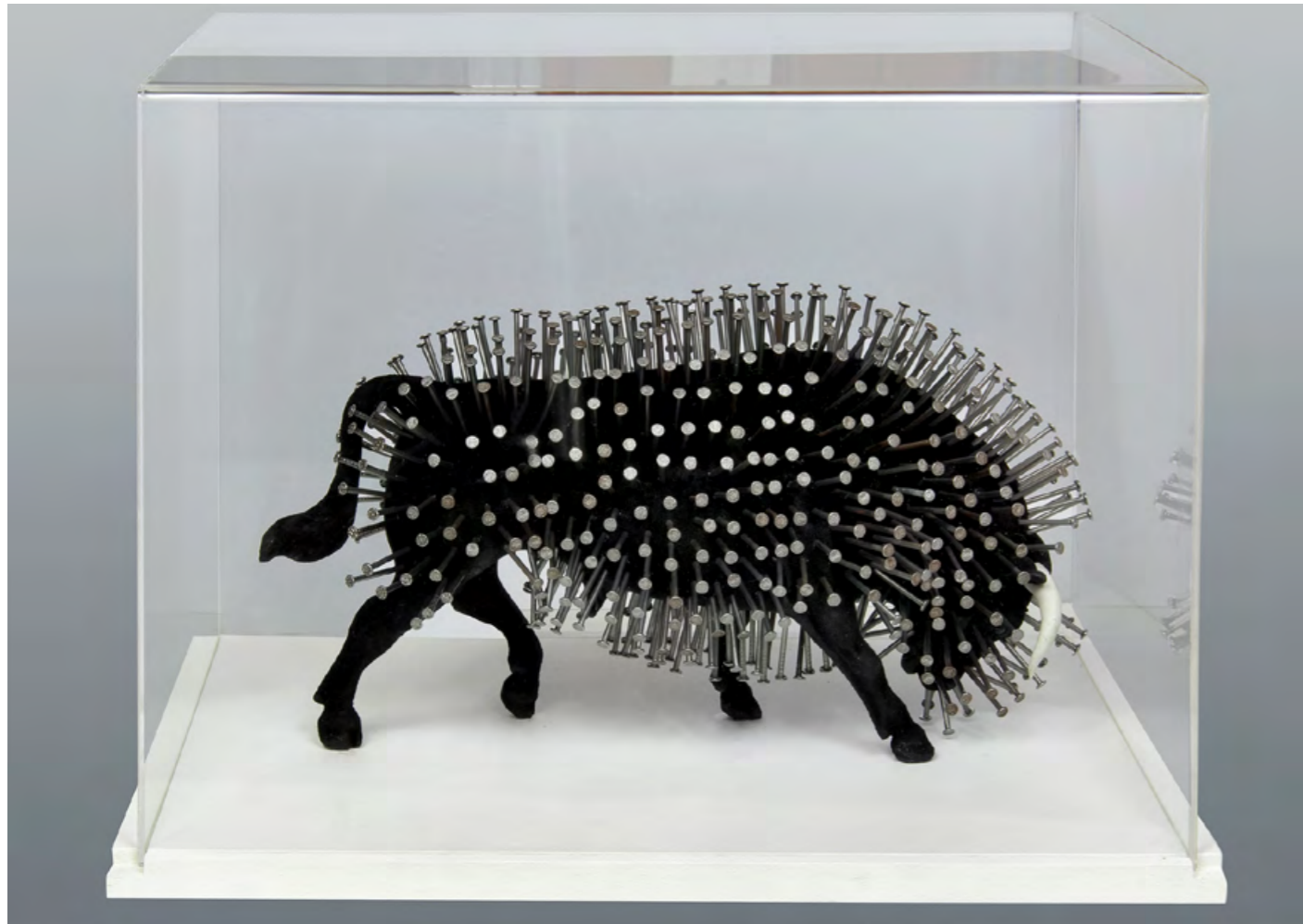
S/T Técnica Mixta 40 x 30 x 30 cm 2012

¿Cuál es el lugar y el motivo de nuestra existencia?