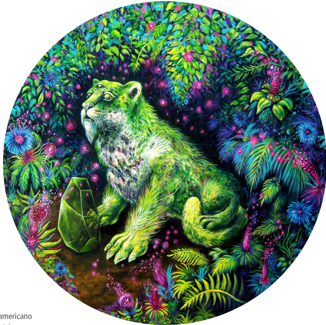
Dragón sudamericano Acrílico sobre tela Ø 100 cm 2011