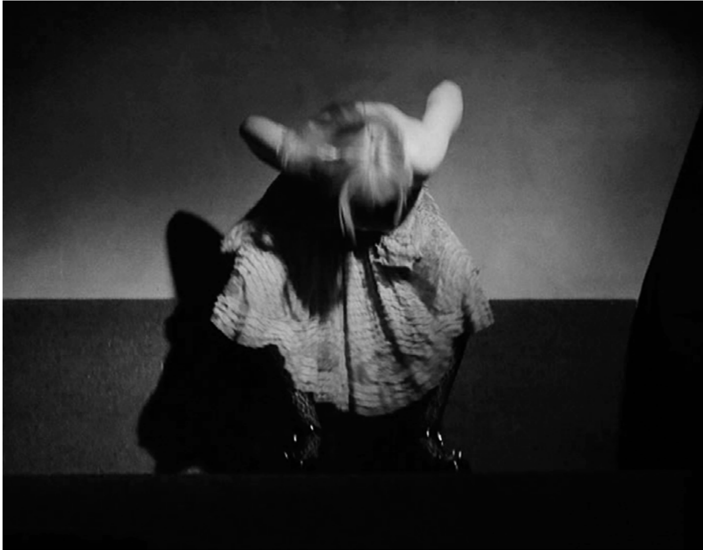
Golden Death Performance 2012

Abierto el tanque, desagotada la sangre, hilo para costura vaginal. La muerte como acto magnífico, en donde el fin se transforma en ser. La dualidad, en una primera instancia, tanquefilia. Se muestra el tanque enaltecido, sumamente femenino, canal de gestación, espacio cóncavo donde nos escondemos, manifestación de la búsqueda de refugio. La forma del tanque se funde con la anatomía femenina, obtiene sus funciones. En una segunda instancia, el desmembramiento de la anterior construcción. El tanque desarmado, abierto, muerto. Obras generadas y construidas en base a performances. El acto como antesala de la producción plástica estética. El atravesar el propio cuerpo para luego producir. La materialidad en el cuerpo, el cuerpo como material, el material como residuo corporal. Qué va primero y qué deviene. Apropiarse para luego transformar. Morir es cada acto de creación, y generación. La obra muerta una vez culminada.