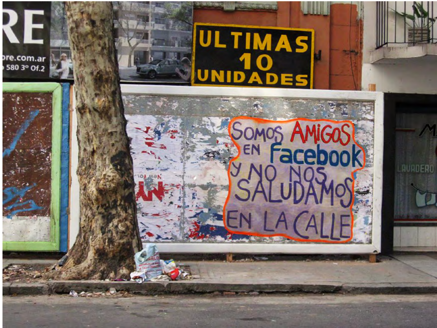
S/T Fotografía Digital Registro de intervención callejera 2012

Mirada femenina y generacional que proyecta estados de ánimo, sensaciones, relata situaciones. Autorreferencial. Textos propios y frases hechas manifiestan una intención declaratoria que se sitúa entre una crítica y una celebración.