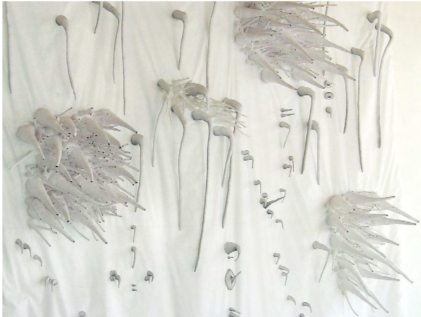
Todavía estoy. En el núcleo vivo y blando. Todavía. (Detalle)

Lápiz sobre tela y costura 200 x 250 x 50 cm 2011