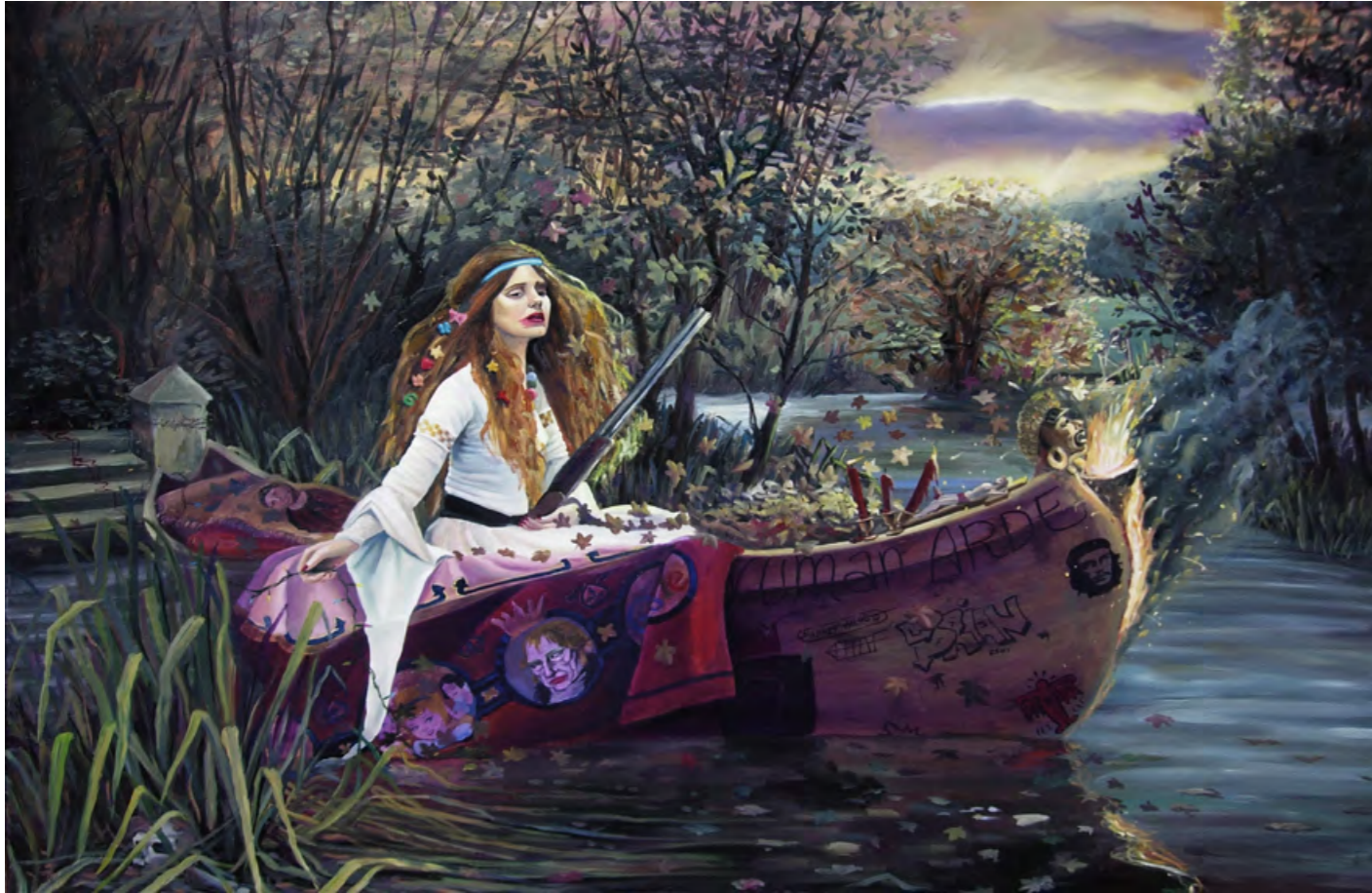
Angelus Novus Óleo sobre tela 80 x 120 cm 2012

Mis obras tejen entramados que se configuran a partir de la vida póstuma de las imágenes. El pasado pierde su vitalidad y reaparece en imágenes espectrales. Los escenarios reconstruidos aluden a sitios intersticiales, espacios que ocupan el lugar del entre (entre la luz y la penumbra, entre el sueño y la vigilia, entre el Edén y el infierno). Las imágenes heredadas se cargan de tiempos anacrónicos que las vuelven a hacer posibles. El movimiento se detiene y se expone el medio como un ámbito de lo indiscernible. Allí, entre la oscuridad de la conciencia mítica y la claridad de la razón, el paisaje se torna abrumador.